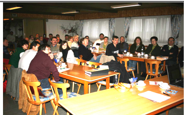
...mit Spannung zugehört